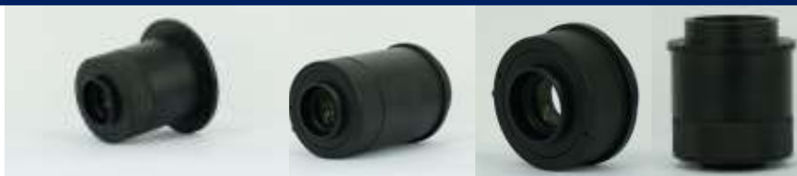
Olympus exfocus x0.5 Cat# exO-05