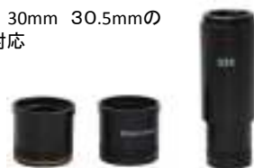
接眼 アダプター Cat#: EP-05